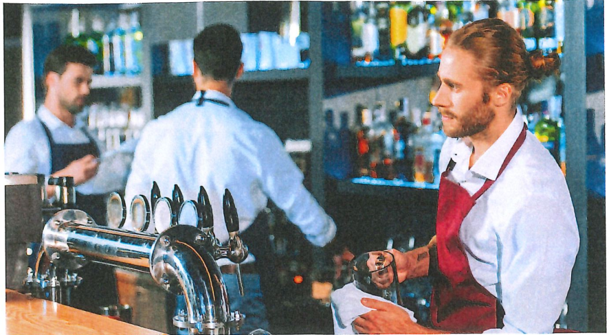
Der individuelle Anspruch auf bezahlte Feiertage hängt vom Anstellungsverhältnis ab.

Bei Teilzeitmitarbeitenden mit festen Arbeitstagen ist die Situation relativ einfach: Fällt ein Feiertag auf einen ihrer regulären Arbeitstage, haben sie frei und erhalten ihren normalen Lohn. Komplizierter wird es bei flexiblen Arbeitstagen. Hier empfiehlt sich eine anteilmässige Berechnung des Feiertagsanspruchs. Beispiel: Ein 50%-Mitarbeiter hätte bei 10 Feiertagen pro Jahr Anspruch auf 5 bezahlte Feiertage. Diese können dann flexibel zugeteilt oder als Zeitguthaben verrechnet werden.