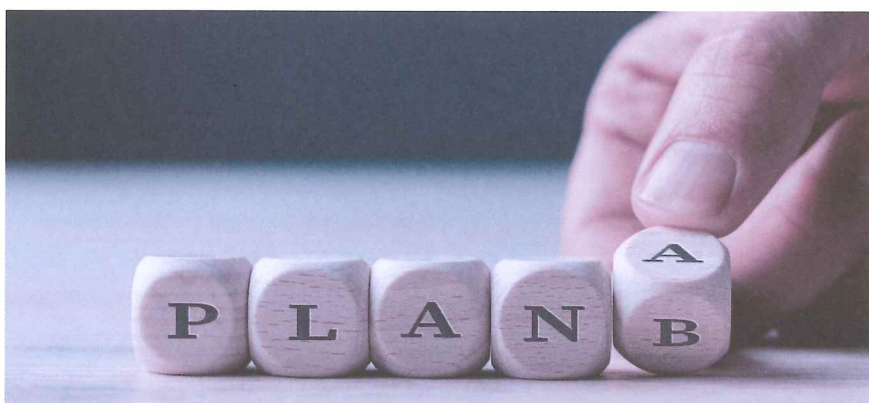
Schafft eine Strategieanpassung neue Chancen, um die Firma zu retten?

Durch eine Nachlassstundung erhält ein Unternehmen für einen bestimmten Zeitraum Schutz vor seinen Gläubigern, sodass es in der Lage ist, Sanierungsmöglichkeiten zu prüfen und umzusetzen. Beim zuständigen Gericht wird hierfür ein Antrag auf Gewährung der Nachlassstundung gestellt, die bei nicht gelungener Sanierung in einem Nachlassvertrag mündet. Während der Coronazeit