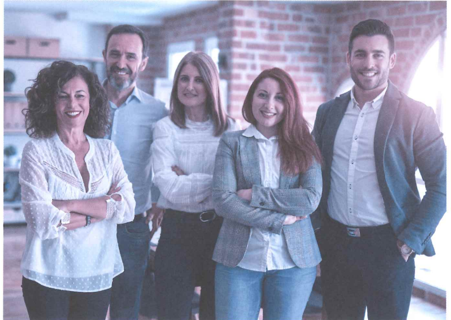
Alles klar: Das Personalreglement schafft eine verbindliche Regelung der Arbeitsbeziehung.

Grundlegender Bestandteil des Personalreglements ist das Arbeitszeitmodell des Unternehmens. Also beispielsweise die gleitende Arbeitszeit mit definierten Blockzeiten, Regelungen zum Homeoffice und die im Betrieb übliche Wochenar-