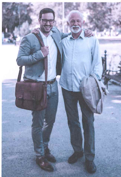
Finanzierung nach dem Umlageverfahren: zuerst einzahlen, später beziehen.

Haben Sie Fragen zu den behandelten Themen oder anderen Treuhandbelangen? Wenden Sie sich an einen Treuhandprofi und achten Sie bei der Wahl auf das Signet TREUHAND|SUISSE – das Gütesiegel für Fachkompetenz und Vertrauenswürdigkeit.