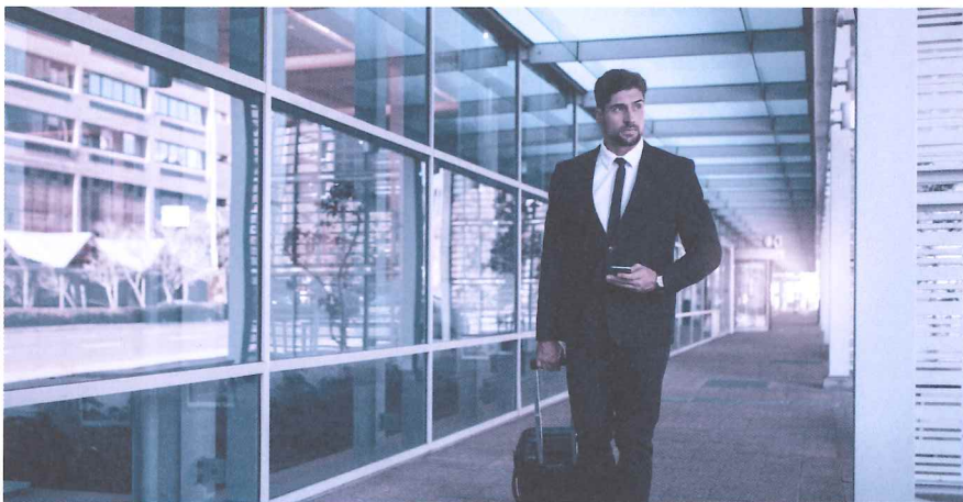
A1-Bescheinigung dabei? Sie ist für alle Aktivitäten im Ausland nötig.

entrichten hat. Es ist für sämtliche grenzüberschreitenden Tätigkeiten nötig, beispielsweise für Berater, Künstler, Journalisten oder Mitarbeiter im Transport oder Baugewerbe, und zwar auch dann, wenn der Aufenthalt nur wenige Stunden beträgt. Ausgestellt wird die A1-Bescheinigung von der AHV-Ausgleichskasse im Wohnsitzland des betroffenen Arbeitnehmers, beantragt wird sie vom Arbeitgeber des Entsandten bzw. direkt vom Selbständigerwerbenden.