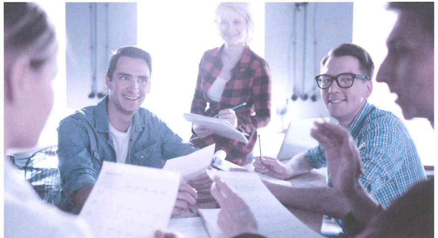
Aktionärbindungsvertrag: ein sinnvolles Instrument, um in guten Zeiten vorausschauende Regelungen für schwierige Phasen zu definieren.

Fast alle Aktionärbindungsverträge sehen Veräusserungsbeschränkungen vor, gerade in Familienbetrieben und Aktiengesellschaften mit wenigen Aktionären. Beispielsweise erwirbt man mit einem Kaufrecht das Recht, Aktien zu erwerben, ohne dass die Zustimmung der anderen Partei erforderlich wäre. Das kann sinnvoll sein, wenn ein Unternehmensaktionär bei der Gründung nicht das ganze Aktienkapital aufbringen kann, aber später den Anlegeraktionär auskaufen will. Vorhandrechte wiederum verpflichten dazu, seine Aktien der anderen Partei anzubieten, bevor ein Vertrag mit einem Dritten abgeschlossen wird. Ein Vorkaufsrecht berechtigt dazu, anstelle eines Dritten zu den Konditionen,