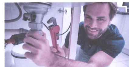
Nicht jeder, der selbstständig erwerbend scheint, ist es auch.

Beiträge fällig, ebenso Beiträge an die Familienausgleichskasse sowie der Beitrag an die Arbeitslosenversicherung.