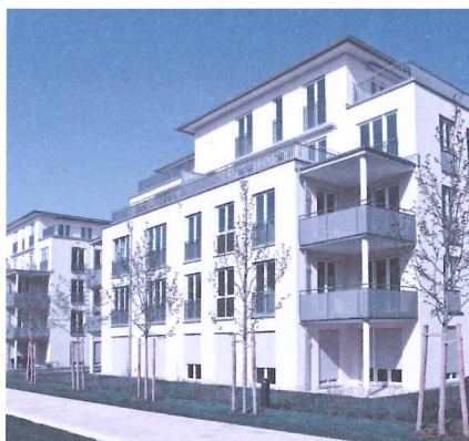
Steigt mit einer Umzonung die Ausnutzungsziffer, entsteht ein Mehrwert.

Im Kanton Zug haben die Stimmberechtigten die Teilrevision des Planungs- und Baugesetzes (PBG) am 19. Mai 2019 gutgeheissen. Das revidierte PBG erfüllt u.a. mit einer Mehrwertabgabe von 20 % auf Einzonungen alle Vorgaben des Bundes. Es bietet neu Gemeinden auch die Möglichkeit, mit einer Anpassung der Bauordnungen eine Mehrwertabgabe von ebenfalls 20 % des Bodenmehrwerts bei Umzonungen, Aufzonungen sowie Bebauungsplänen mit erheblicher Erhöhung der Ausnutzung einzuführen. Die Gesetzesrevision ist seit dem 1. Juli 2019 in Kraft.