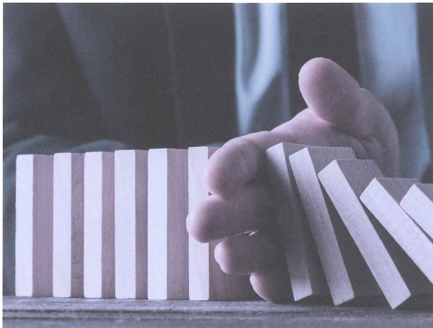
Wer seine Risiken kennt, kann sich vorbereiten und deren Auswirkungen mindern.

Fast alle Risiken sind die Folgen von menschlichem Handeln und können beeinflusst werden. Demnach kann man sich grundsätzlich auf Risiken vorbereiten und sich vor ihnen und ihren Folgen schützen. Grundsätzlich unterscheidet man strategische und operative Risiken. Die strategischen Risiken betreffen übergeordnete Entwicklungen: im Markt oder in der Umwelt, in der Führung oder der (finanziellen) Organisation, in den Geschäftsprozessen. Normalerweise identifiziert man solche Risiken mithilfe eines